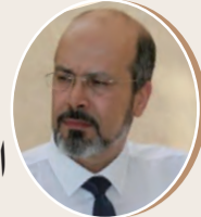
بقلم: مصطفى علمان ص 8

وقفات فكرية أهمية الدرس التربوي الديني في تمكين المتعلمين