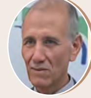
بقلم: العربي عقون ص 9

يجمع بين الجغرافيا والتاريخ والجيولوجيا الموجز في التعريف بكتاب "حوزتيسة"