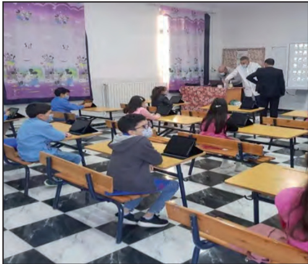
هذه المرافق أن تستعمل في تحسين ظاهرة الاكتظاظ التي تعاني منها ظروف التمدن، وكذا الحد من بعض المؤسسات التربوية بالولاية.

قامت مصالح مديرية التربية لولاية البويرة بتجهيز 45 مدرسة ابتدائية بالألواح الإلكترونية بمعدل مدرسة في كل بلدية عبر إقليم الولاية، و ينتظر استلام حصة أخرى خلال الأيام القادمة لتجهيز 13 مدرسة للوصول إلى مدرستين في كل بلدية