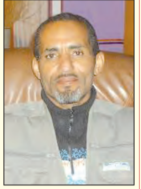
بقلم: محمد حسنة الطالب

لم يعد في العالم اليوم من يصدق تلك المفاهيم الجذابة التي يستخدمها الغرب كلما راودته أحلام الهيمنة والتسلط على أماكن إستراتيجية من العالم ، فتوظيف القانون ومواثيق الشرعية الدولية والحديث عن الديمقراطية وحقوق الإنسان لغرض تحقيق مصلحة معينة في بلد ما ، لم يحدث أن حل مشاكل