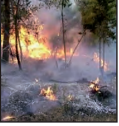
اندلع حريق غابة أمس، بمنطقة أزرار بمسابط في المليية بولاية جيجل، حيث تعمل مصالح الحماية المدنية على إخماده. وحسب بيان لمديرية الحماية المدنية بالولاية، تدخلت فرق ووحدات الحماية المدنية لكل من المليية، وبوتياس، وسطارة، سيدي معروف في هذه العملية، بإمدادات الرتل المتثقل ومصالح الغابات. وأضافت ذات

المصالح، أن هبوب رياح قوية والتضاريس الصعبة، صعبا من عمل الحماية المدنية. وأكدت ذات المصالح، أن الحريق لا يشكل خطرا على السكان كون المساكن مهجورة.