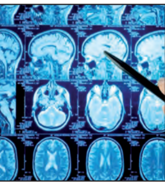
في التجربة، نجح ستة منهم لأكثر من عامين، وثلاثة ظلوا على قيد الحياة لأكثر من ثلاث سنوات، ومريض واحد، والذي ما يزال على قيد الحياة عند كتابة الورقة البحثية، نجح لمدة تصل إلى خمس سنوات.

أظهر علاج جيني من سرطان شديد العدوانية يصيب الدماغ نتائج واعدة، حيث يقوم على أدوية قتل الخلايا، وتحفيز المناعة. وهذه هي المرحلة الأولى في التجارب البشرية، وقد قام باحثو قسم جراحة الأعصاب ومركز روجيل لسرطان بجامعة ميشيغان، بقيادة بيدرو لوينشتاين وماريا كاسترو، بتطوير ودراسة العلاجات الجينية للفيروسات الغدانية في مختبرهم. ونظرا للتشخيص السيئ للأورام الدماغية والاستجابة المحدودة لعلاجات مثل العلاج الكيميائي والإشعاعي، تطوع الفريق إلى استخدام البروتين Flt3L لتجنيد الخلايا المناعية التي تكون غائبة عادة عن الدماغ. وهذه الخلايا المناعية مطلوبة لبدء استجابة مناعية أكثر فعالية للسرطان. ومن بين المرضى الثمانية عشر المسجلين